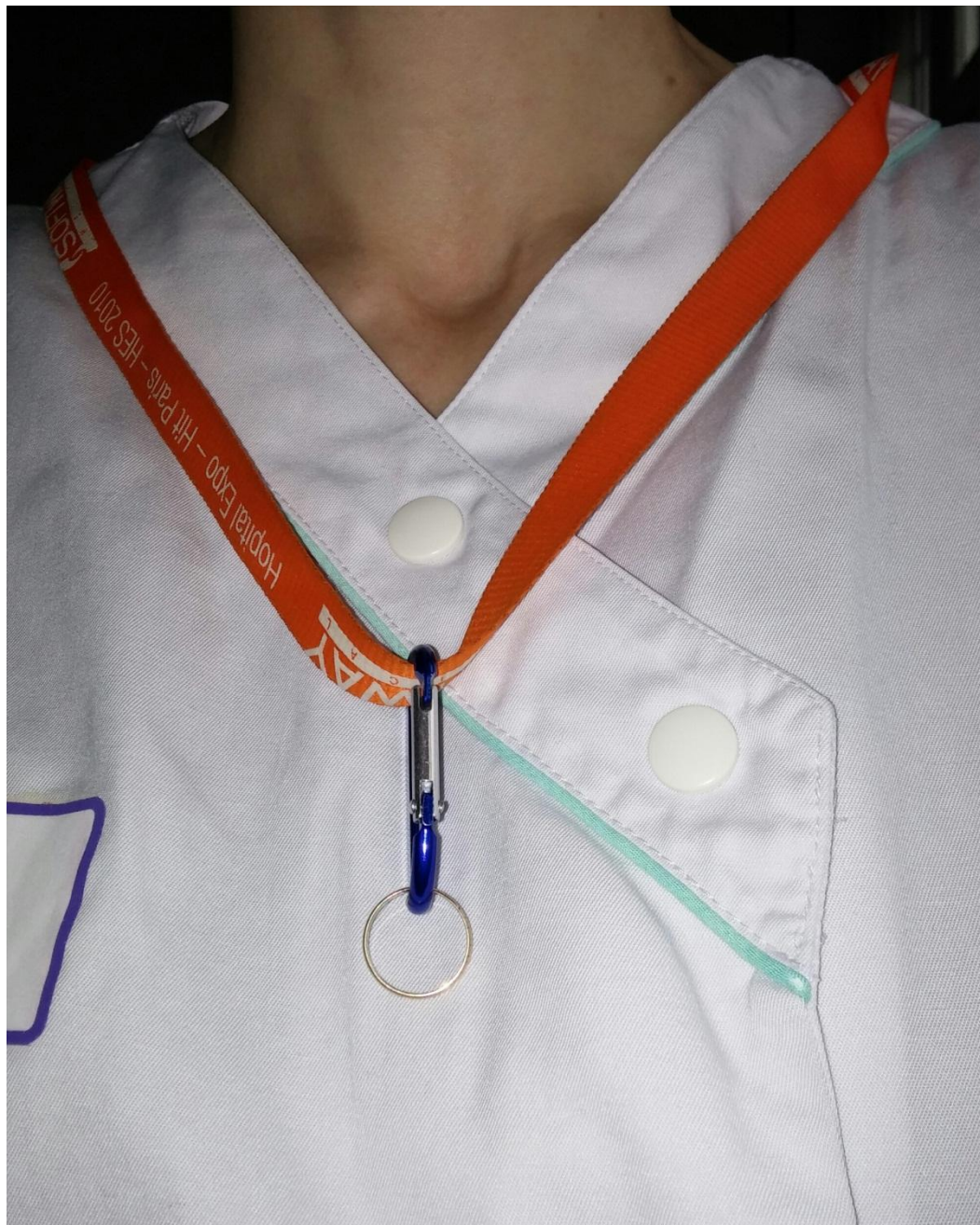
Groupe GRIHHN Hygiène des mains - Décembre 2014